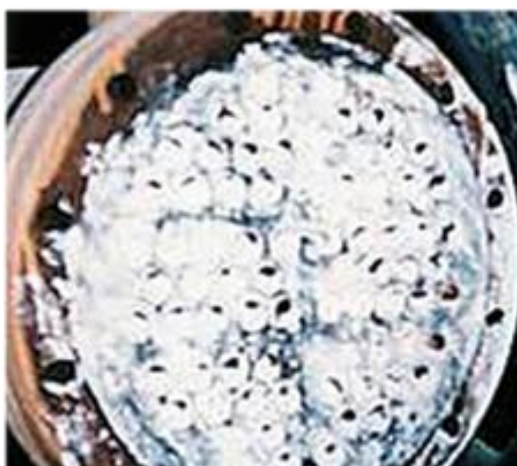
Mikroskopaufnahme: Vorher-/Nachher Vergleich